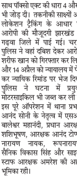
साथ पाँचसो एक की धारा 4 और 6 भी जोड़ दी।