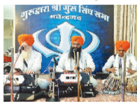
अत्यंत श्रद्धा, उत्साह और उल्लास के साथ मनाया गया।

शहर के गुरुद्वारा गुरू सिंह सभा में 14 अप्रैल को बैसाखी के पावन अवसर पर खालसा सृजन दिवस