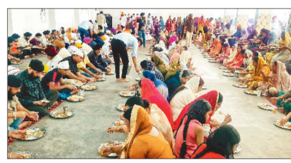
अत्यंत श्रद्धा, उत्साह और उल्लास के साथ मनाया गया।

अत्यंत श्रद्धा, उत्साह और उल्लास के साथ मनाया गया। इस दौरान काफी संख्या में श्रद्धालुओं, महिलाओं और बच्चों (नव निहालों) की उपस्थिति रही। पूरे गुरुद्वारा परिसर में भक्ति और आस्था का माहौल देखने को मिला। इस अवसर पर सिख धर्म के दशम गुरु-गुरु गोविंद सिंह द्वारा खालसा