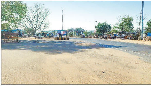
दोपहर में सूनसान दिख रही सड़क।

जानकारी के अनुसार मंगलवार को अधिकतम तापमान 38 डिग्री दर्ज किया गया और दिनभर तेज धूप का असर रहा। मौसम विभाग के अनुसार बुधवार को अधिकतम तापमान 40 डिग्री तक पहुंचने की संभावना है, इसके दूसरे दिन गुरुवार को एक डिग्री तापमान और बढ़कर अधिकतम पारा 41 डिग्री हो जाएगा। अप्रैल माह की शुरूआत