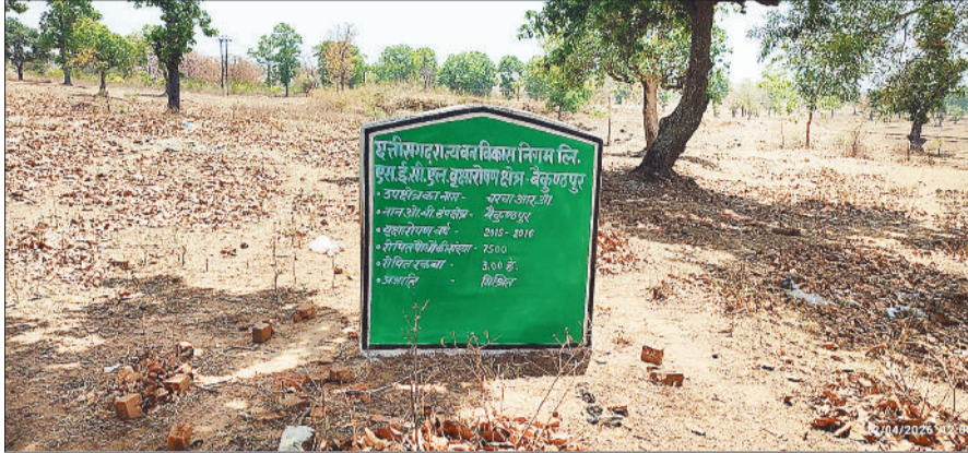
नहीं दिखते रोपे गए पौधे ।

उक्त स्थल पर जहां पेड़ों की हरियाली दिखाई देनी चाहिए, वहां पुराने पेड़ों के अलावा खाली जमीन दिखाई देता है। इस तरह पौधरोपण के नाम पर लाखों रूपए बर्बाद कर दिए गए और पर्यावरण संरक्षण के नाम पर सरकारी खजाने को किस तरह से चूना लगाया जाता है, इसका जीता जागता उदाहरण जिले के कटगोड़ी क्षेत्र में देखने को मिल रहा है। मिली जानकारी के अनुसार छग वन विकास निगम एवं एसईसीएल पौधरोपण क्षेत्र बैकुंठपुर उप क्षेत्र चरचा आरओ नॉन ओबी डंप क्षेत्र बैकुंठपुर के अंतर्गत कटगोड़ी शॉफ्ट रोपित पौधों में वहां आज एक भी पौधा जीवित नहीं है। लाखों की लागत से यहां का पौधरोपण अब केवल फाइलों व ऑकड़ों तक सीमित रह गया है।